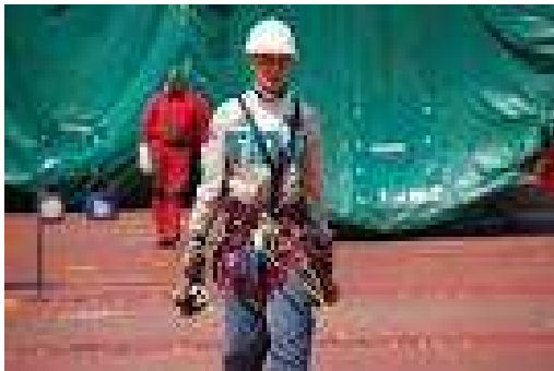
Docker « attaché ».

Les chauffeurs de cavaliers accèdent maintenant à leur cabine par des passerelles et les grimpeurs utilisent des nacelles pour monter sur les conteneurs et sont harnachés.